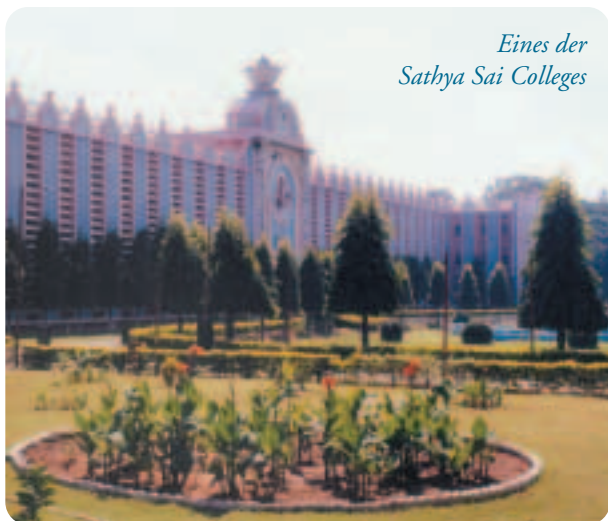
Eines der Sathya Sai Colleges

Er hat Institutionen gegründet, die von der Grundschule bis zur Universität kostenlose Bildung anbieten. Sie erreichen das höchste Niveau der staatlich vorgegebenen Bildungsprogramme. Seine Erziehung beruht auf den fünf menschlichen Werten: Wahrheit, Rechtes Handeln, Friede, Liebe und Gewaltlosigkeit. Die Vermittlung dieser Werte hat zur Folge, dass die Studierenden, einmal in der Gesellschaft tätig, nach diesen Prinzipien leben. Die Arbeit wird somit nicht nur als Mittel zur Beschaffung von Geld und materiellen Gütern betrachtet, sondern auch als Instrument, um den Menschen und der Gesellschaft besser zu dienen. Akademiker mit einem Abschluss an den Universitäten von Sai Baba sind auf der ganzen Welt gefragt. Sie sind exzellent ausgebildet und bekannt für ihre Korrektheit, Integrität und Professionalität.