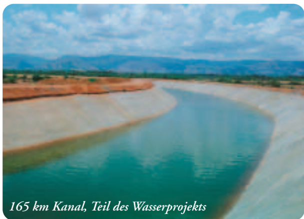
165 km Kanal, Teil des Wasserprojekts

Sai Baba hat für all diese Projekte nie Geld verlangt. Wer es wünscht und über die nötigen Mittel verfügt, dem gibt Sai Baba die Möglichkeit, diese zum Wohl aller einzusetzen.