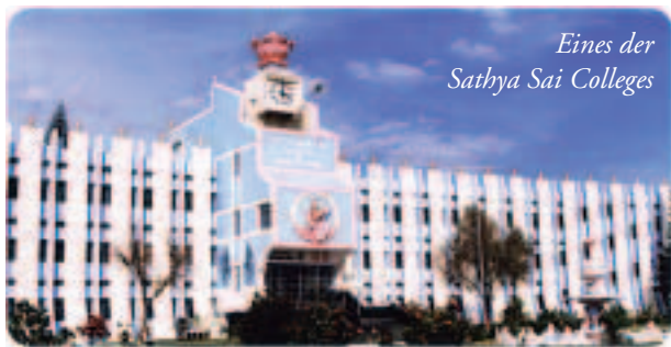
Eines der Sathya Sai Colleges

«Unwissenheit ist das grösste Übel im Leben. Unwissenheit ist die schwerste Last im Leben. Unwissenheit ist undurchdringliche Finsternis. Unwissenheit ist die Ursache von Unglück im Leben. Nicht derjenige, der nicht sieht, ist blind, sondern derjenige, der nicht sehen will. Egoismus ist die Wurzel aller Probleme. Lasst das Ego los und alle Probleme werden verschwinden.»