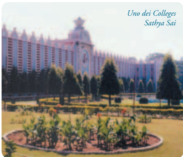
Uno dei Colleges Sathya Sai

Ha fondato sistemi educativi scolastici a tutti i livelli; da quello elementare a quello universitario, completamente gratuiti, dove il massimo sviluppo dei programmi statali è conseguito basandosi sui Valori Umani: Verità, Rettitudine, Pace, Amore e Non-Violenza. L'insegnamento di questi Valori fa sì che lo studente s'inserisca nel tessuto sociale vivendo questi Principi. Il lavoro, quindi, non viene considerato solo come mezzo per acquisire denaro e beni materiali, ma come strumento per servire al meglio l'uomo e la società. I laureati delle Università di Sai Baba vengono richiesti in tutto il mondo poiché, oltre ad un'eccellente preparazione scolastica, l'integrità della loro vita rappresenta una prestigiosa garanzia di correttezza e professionalità.