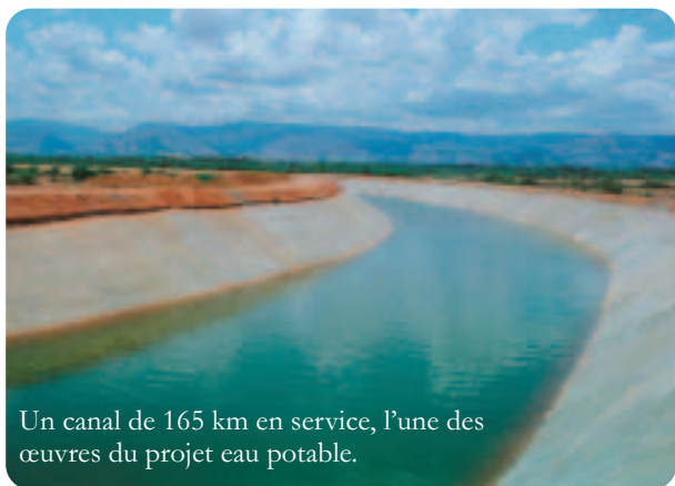
Un canal de 165 km en service, l'une des œuvres du projet eau potable.

Sai Baba n'a jamais demandé d'argent pour tous ces travaux. Il donne seulement la possibilité aux volontaires qui en ont la capacité et les moyens d'en faire usage pour le bien de tous.