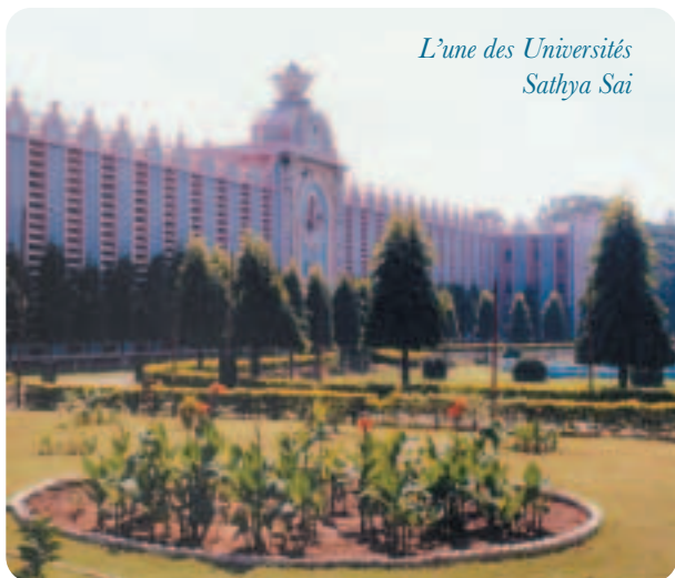
L'une des Universités Sathya Sai

Les diplômés des Universités de Sai Baba sont demandés à travers le monde entier car, au-delà de leur excellence académique, leur intégrité représente une garantie d'honnêteté et de compétence professionnelles.