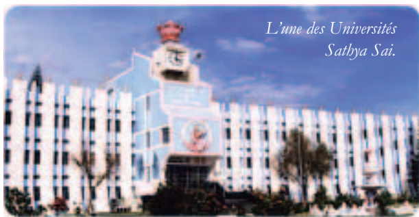
L'une des Universités Sathya Sai.

« L'ignorance est le pire fléau de la vie. L'ignorance est le plus lourd fardeau de la vie. L'ignorance est l'obscurité trompeuse la plus épaisse. L'ignorance est cause de la ruine dans la vie. Celui qui ne peut pas voir n'est pas l'aveugle, l'aveugle est celui qui ne veut pas voir. L'ego est la racine de tous les problèmes. Abandonnez votre ego et ils disparaîtront. »